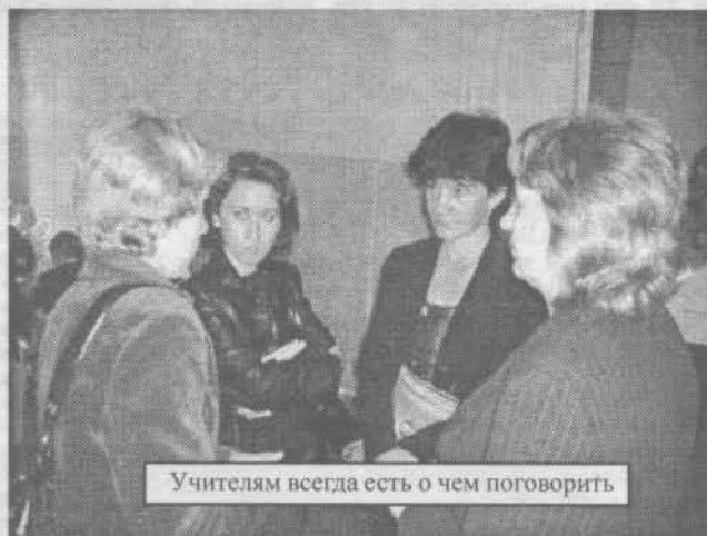
Учителям всегда есть о чем поговорить

Она требовательна и справедлива и всегда готова прийти на помощь в трудную минуту.